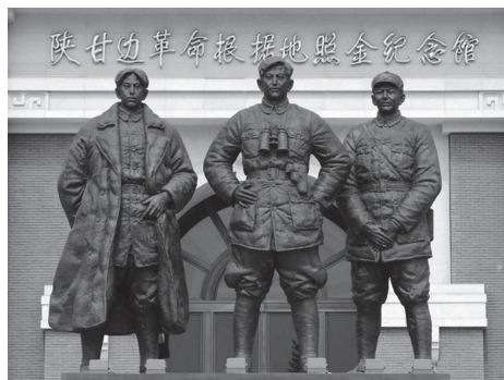
右起：习仲勋、刘志丹、谢子长

红军干部学校，刘志丹兼任校长，习仲勋兼任政委。学员主要来自部队中下层干部，也有少数地方干部参加，先后培训干部三期，约三百余人。与此同时，习仲勋领导边区苏维埃政府广泛开展移风易俗活动，成立禁毒、禁赌、放足委员会，制定反对包办婚姻、封建迷信条例，开展“劝破除迷信、劝戒赌博、劝戒鸦片烟、劝禁止买卖婚姻、劝妇女放脚、劝男子剪辫子”的“六劝”活动，教育引导群众从封建思想的枷锁下解放出来。其四，扩大红军队伍，加强军事斗争。习仲勋领导陕甘边区苏维埃政府在扩大红军活动中，实行自愿兵役制，群众参加游击队后，经过一个时期的训练，成建制编入红军队伍。在战斗动员上规定了各种条例，如少先队、赤卫队条例，动员方式是自愿的，武器是没收豪绅地主的，在军纪上也规定出新的条例；在赤卫队、少先队的基础上广泛地成立游击小组；奖励群众买武器，买到新武器则给特别奖励，收缴敌人的武器归自己使用；成立民间递步哨，帮助红军做情报工作；对牺牲的战士和赤少队员付给埋葬费和抚恤费。这些“扩红”的法令政策收到了显著效果，陕甘边红军战斗力不断增强，红二十六军四十二师兵力扩大到2000多人，各路游击队扩大到3000多人，赤卫队也发展到5000多人。在习仲勋和陕甘边区苏维埃政府的支持帮助下，红二十六军主力发展成兵强马壮的西北红军，粉碎国民党军队的多次“围剿”，攻城拔寨，克敌制胜，捷报频传。