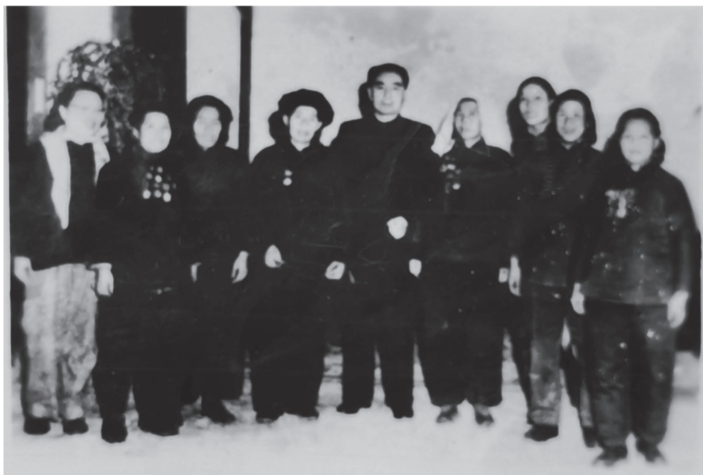
1957年2月18日祖母与周总理合影（前排右三）