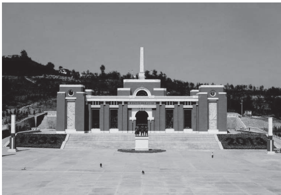
陕甘边革命根据地照金纪念馆

1933年春，习仲勋回到红二十六军，任红二团先锋连指导员，参加了此后红二十六军创建照金苏区的一系列作战行动。3月8日，中共陕甘边区特别委员会在耀县照金镇兔儿梁成立，金理科任特委书记，习仲勋任特委军委书记。4月5日，在中共陕甘边区特委领导下，陕甘边区第一届工农兵代表大会在照金兔儿梁召开，选举产生了陕甘边区革命委员会，雇农周冬至当选主席，习仲勋任副主席兼党团书记。4月，红二十六军党委改组陕甘边区游击队总指挥部，习仲勋任政委。作为照金苏区党政军的重要领导人，习仲勋在环境恶劣、物质匮乏的条件下，倾注了超凡的智慧和无尽的心血，为根据地的建立、巩固和发展做出了重要贡献。习仲勋首先以主要精力发动群众，建立红军游击队和群众武装。他“一村一村地做调查研究，一家一户做群众工作，相继组织起农会、贫农团、赤卫队和游击队，同时发动群众进行分粮斗争。由于这一带1929年大旱之后灾情严重，群众生活还没有恢复过来，所以分粮斗争很快就发展到旬邑、耀县一带，游击运动随着扩大起来”。陕甘边区游击队总指挥部改组后，习仲勋作为党在游击队的主要负责人，根据此前的革命经验，首先在队伍中加强党的工作力量，对边区二十多支游击队进行彻底整顿，坚决遣散了一批纪律涣散、成分不纯的人员，开展了阶级教育和纪律教