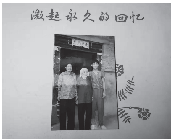
图为母亲、祖母和弟弟（自左向右）

人家学习，不忘初心，方得始终，坚定共产主义理想信念，忠诚党的事业，热爱祖国，诚信友善，学习榜样，立足本职，爱岗敬业，把全部精力投入到工作中去，时刻以一名优秀党员的标准严格要求自己，牢记使命，永葆初心，全心全意为人民服务，努力为实现中国梦贡献自己的力量，在本职岗位上做出更大的贡献！